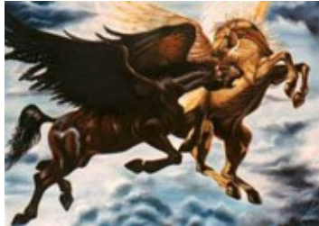
Lotta tra il bene e il male

*** Capacità di scoprire meccanismi inattesi dell' Evoluzione - Ecco un brano tratto dal